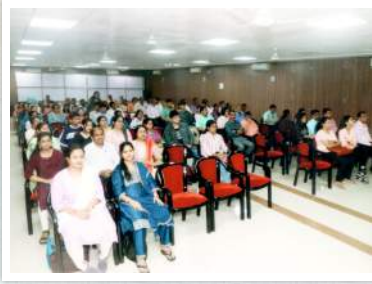
बँकेच्या सभासदांचा व त्यांच्या पाल्यांचा गुणगौरव समारंभ कार्यक्रमात उपस्थित पालक वर्ग