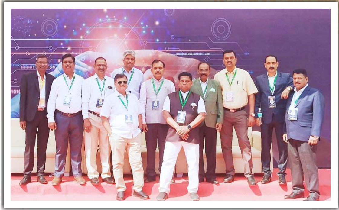
नाशिक येथे आयोजित महाराष्ट्र राज्य नागरी सहकारी बँक्स परिषद २०२३-२४ येथे उपस्थित संचालक मंडळ