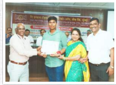
गुणवंत विद्यार्थ्यांना प्रमाणपत्र देऊन गुणगौरव करताना मान्यवर प्रमुख पाहुणे