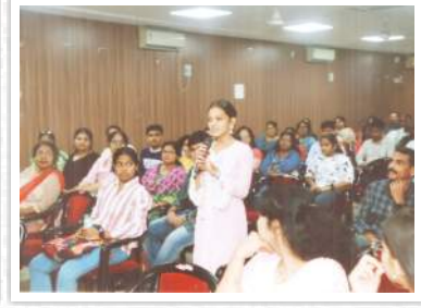
शैक्षणिक मार्गदर्शनाबाबत सविस्तर माहिती घेत असताना