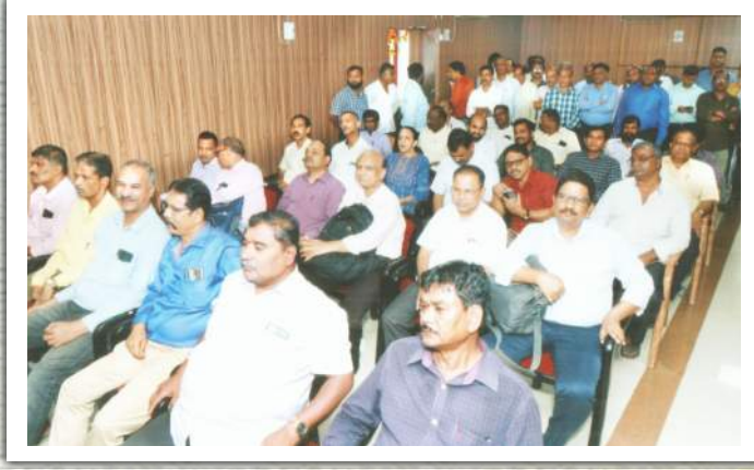
◀ ९७ व्या वार्षिक सर्वसाधारण सभेस उपस्थित सभासद