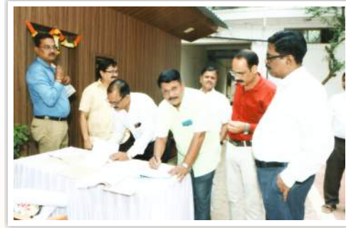
१७ व्या वार्षिक सर्वसाधारण सभेच्या ठिकाणी उपस्थित सभासदांची नोंदणी सुरु असताना