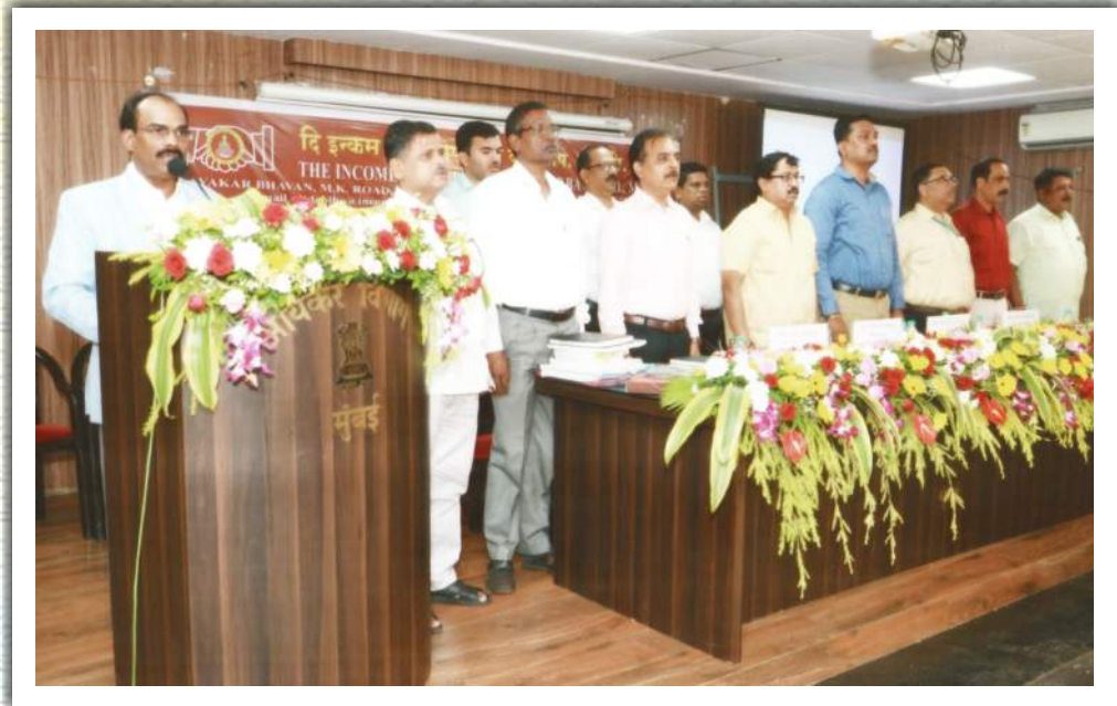
९७ व्या वार्षिक सर्वसाधारण सभेची राष्ट्रगीताने सांगता करताना बँकेचे सर्व संचालक मंडळ व मुख्य कार्यकारी अधिकारी