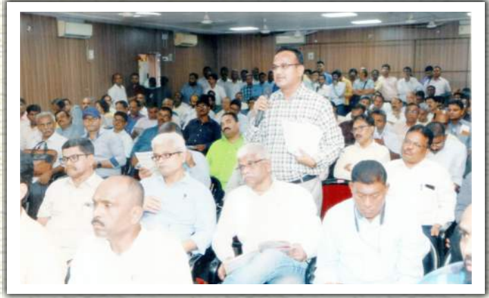
९७ व्या वार्षिक सर्वसाधारण सभेत सभासद प्रश्न उपस्थित करताना ▶