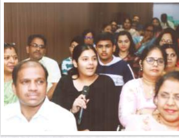
बँकेच्या सभासदांच्या पाल्यांच्या गुणगौरव समारंभात विद्यार्थ्यांनी मार्गदर्शना बाबत प्रश्न उपस्थित करताना