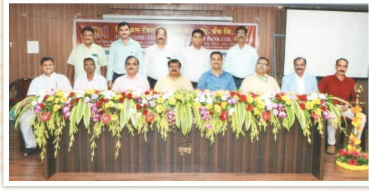
१७ व्या वार्षिक सर्वसाधारण सभेत मंचावर उपस्थित कार्याध्यक्ष / उपकार्याध्यक्ष, बँकेचे सर्व संचालक मंडळ व मुख्य कार्यकारी अधिकारी